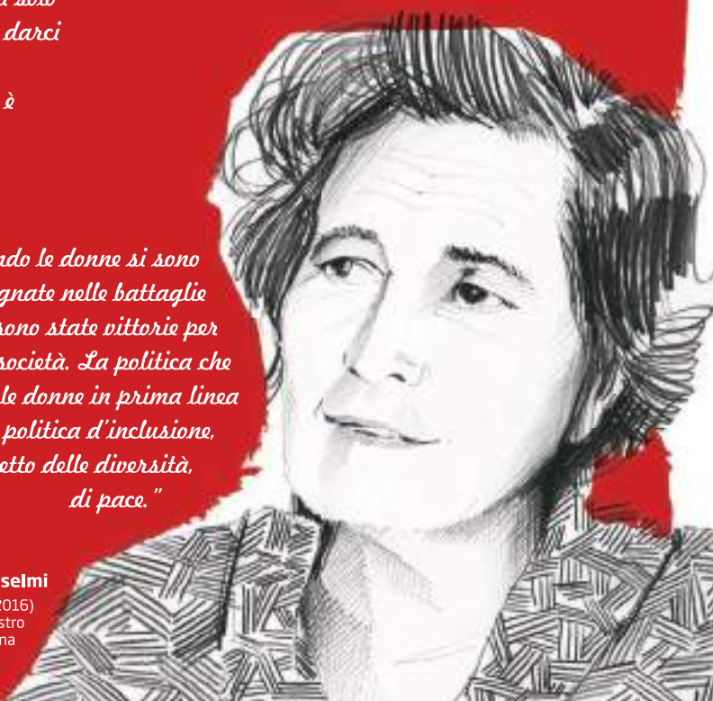
Tina Anselmi politica, partigiana (1927-2016) prima donna ministro della Repubblica italiana

Il 2 giugno 1946 il suffragio universale e l'esercizio dell'elettorato passivo portarono per la prima volta in Parlamento anche le donne. Si votò per il Referendum istituzionale tra Monarchia e Repubblica e per l'Assemblea Costituente che si riunì il 25 giugno del 1946. Su un totale di 556 deputati furono elette 21 donne: la loro intesa passione politica le porterà a superare i tanti ostacoli che, all'epoca, resero difficile la partecipazione delle donne alla vita politica.