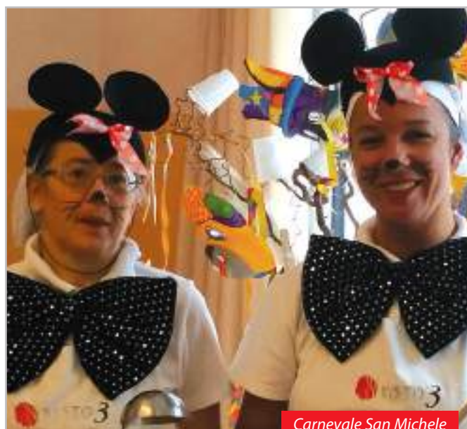
Carnevale San Michele