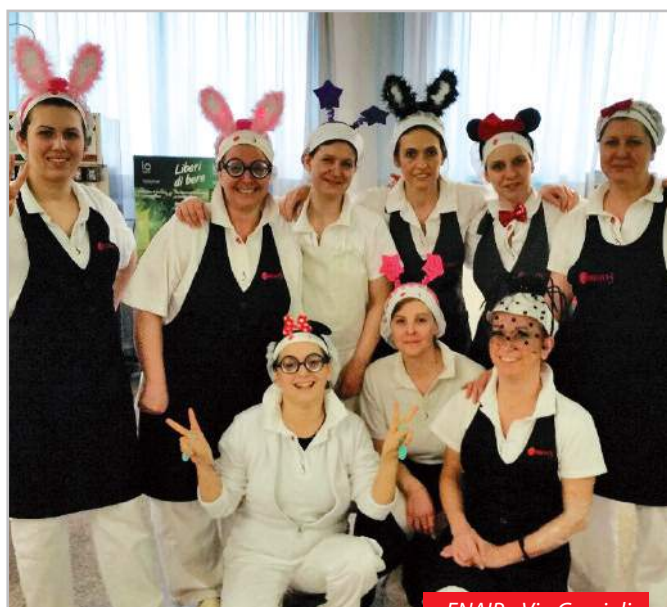
ENAIIP - Via Grazioli