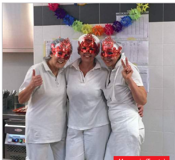
Manzoni - (Trento)