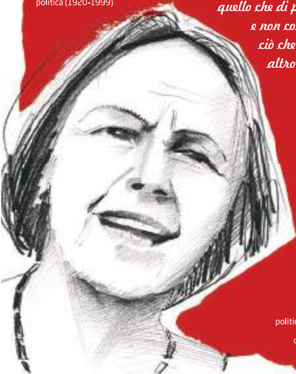
Nilde Iotti politica (1920-1999)

"È necessario cogliere negli altri solo quello che di positivo sanno darci e non combattere ciò che è diverso, che è altro da noi."