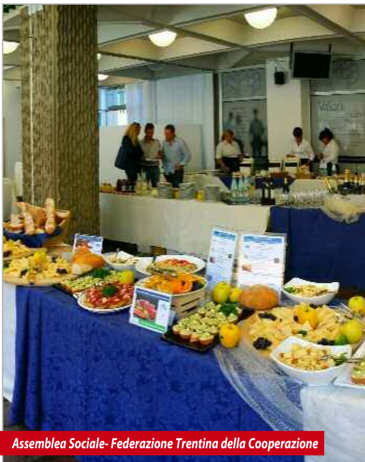
Assemblea Sociale- Federazione Trentina della Cooperazione