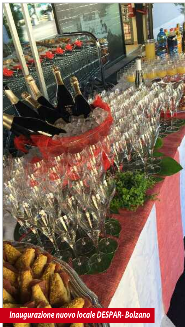
Inaugurazione nuovo locale DESPAR- Bolzano

Nelle foto si possono vedere alcuni dei servizi gestiti durante l'estate delle nostre colleghe del Party.