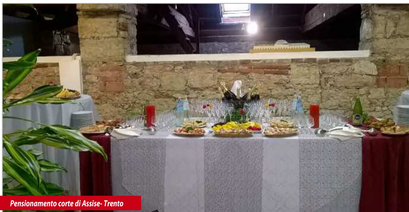
Pensionamento corte di Assise- Trento